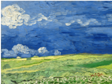
Van Gogh, Weizenfeld unter Gewitterwolken