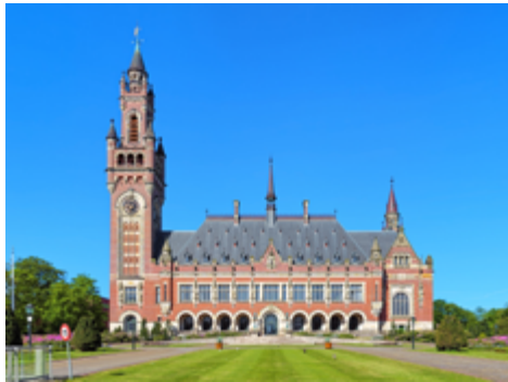
Friedenspalast in Den Haag