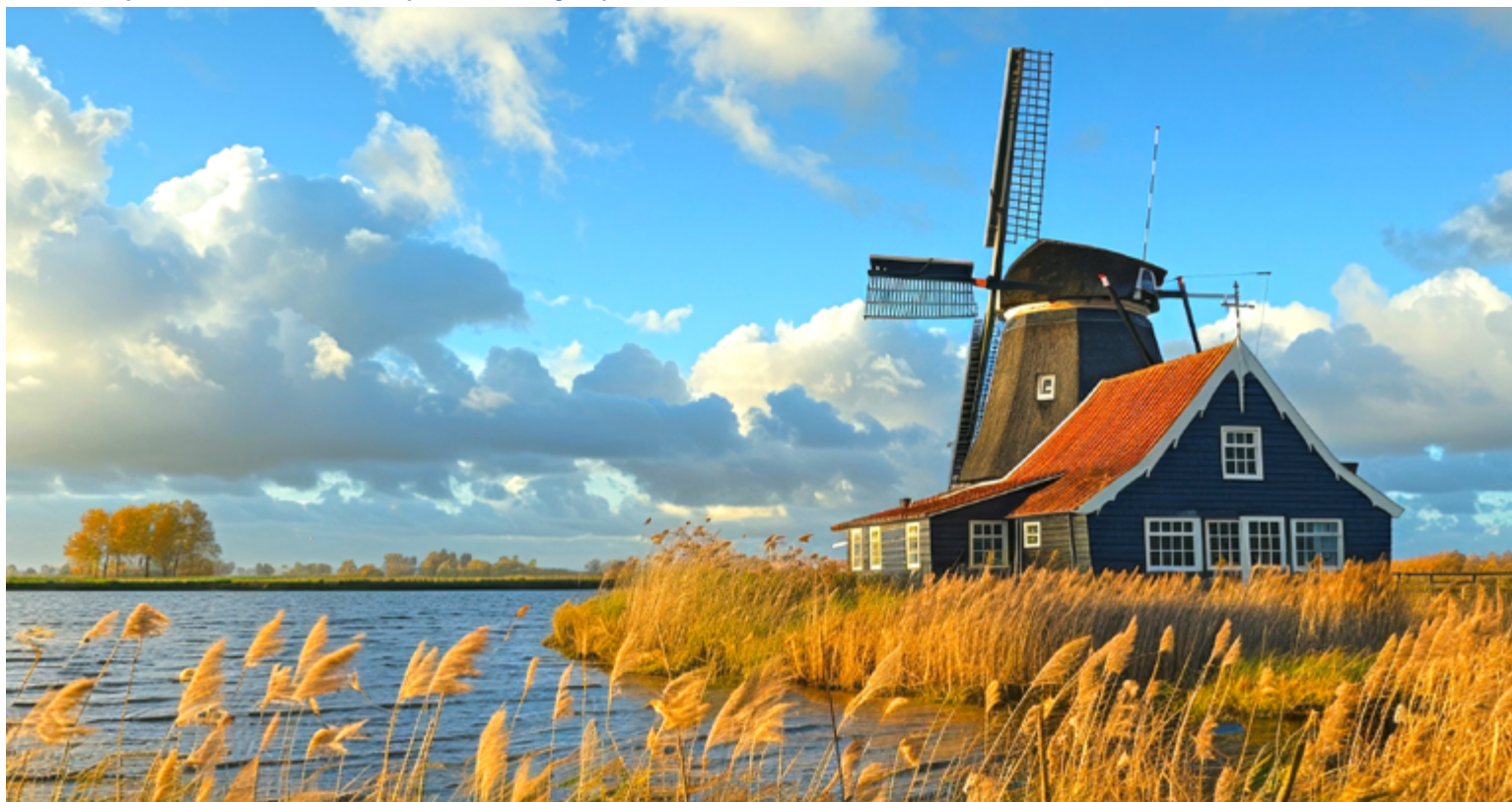
Herbst in Holland