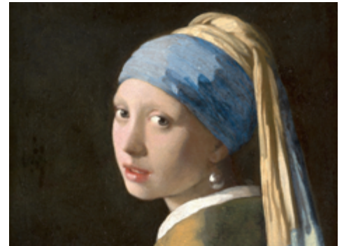
Vermeer: Mädchen mit Perlenohrgehänge

Herbst 2024 · 6 Tage · ab/an Köln · ab € 1.599,- p.P.