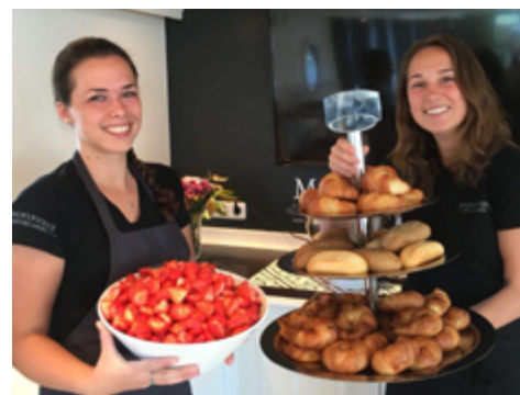
Willkommen an Bord