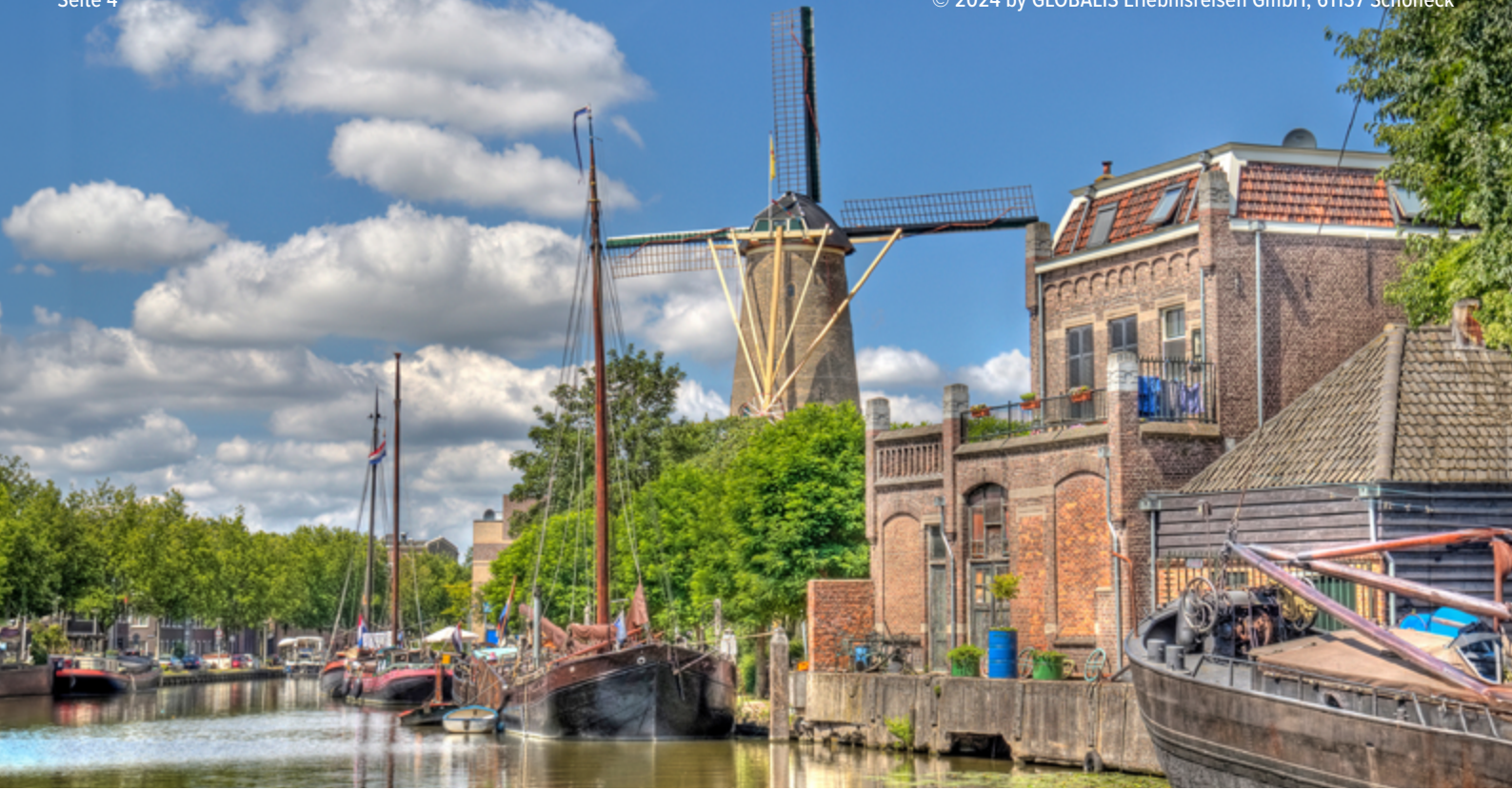
Windmühle in Gouda