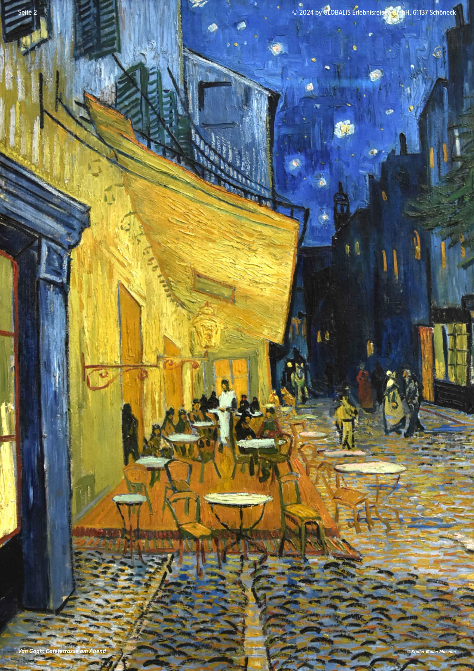
Van Gogh: Cafétterasse am Abend