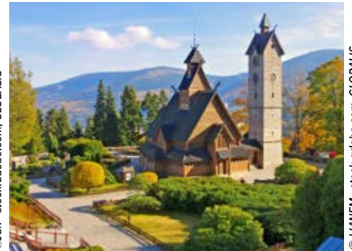
Stabkirche in Krummhübel