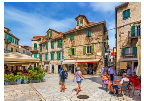
In der Altstadt von Split