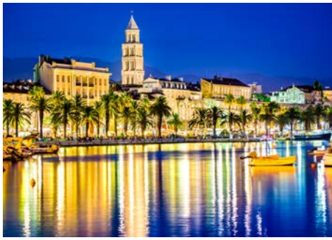
Uferpromenade von Split