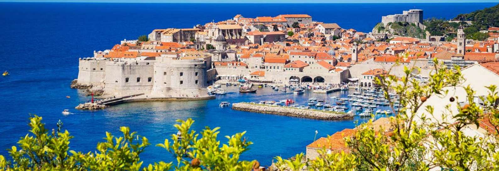
Die Altstadt von Dubrovnik