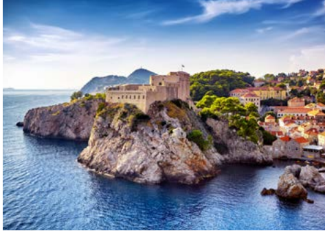
Festung Lovrijenac in Dubrovnik