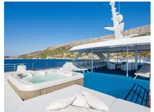
Whirlpool auf dem Sonnendeck