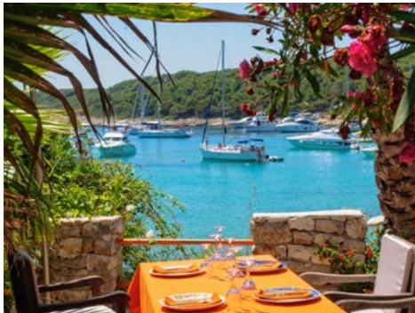
Im Hafen von Hvar