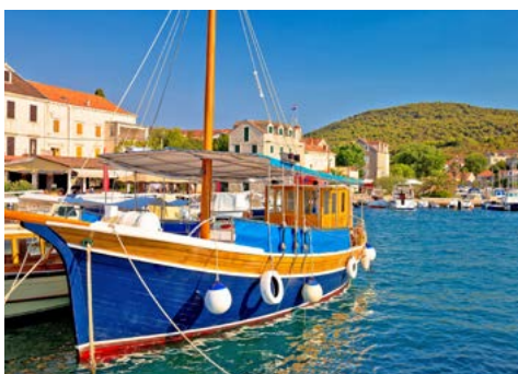
Hafen auf Zlarin