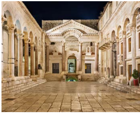
Diokletianspalast in Split