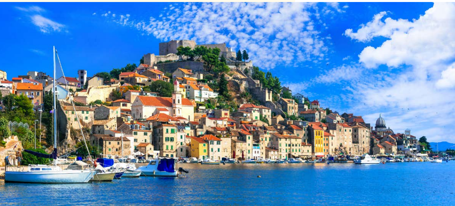
Blick auf Šibenik