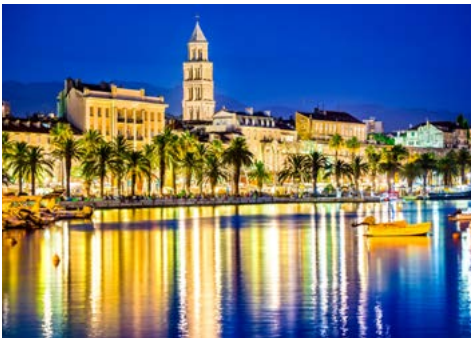
Uferpromenade von Split