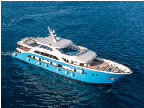
Deluxe Motoryacht San Antonio