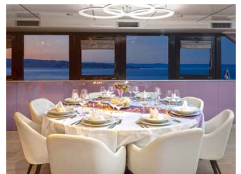
Gepflegte Kulinarik im Bordrestaurant