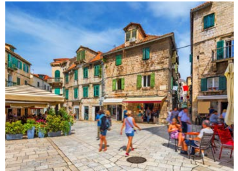
In der Altstadt von Split