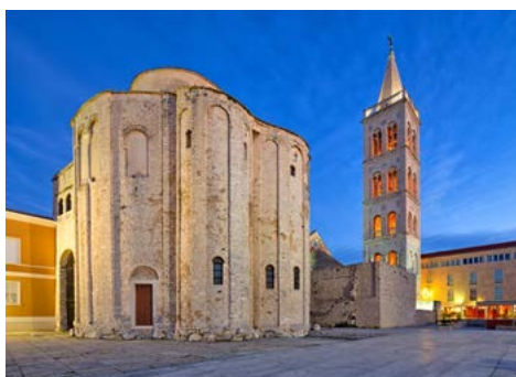
St. Donatus Kirche in Zadar