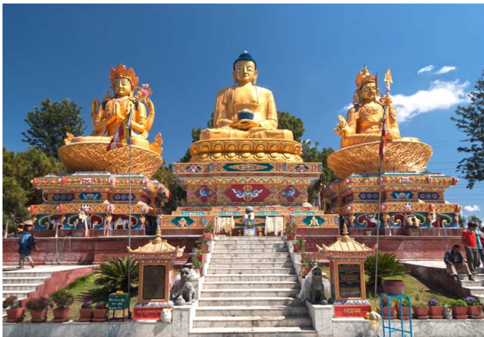
Wunderschöne Figuren in Kathmandu