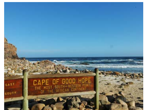
Kap der Guten Hoffnung