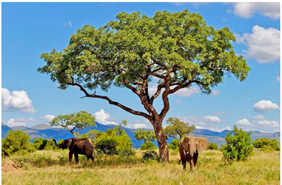
Elefanten im Kruger National Park