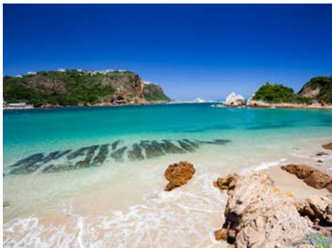
Strand in Knysna