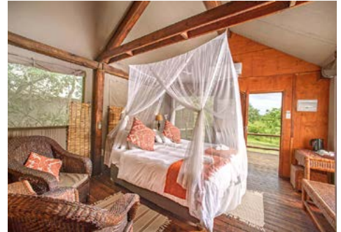
Nkambeni Safari Camp Luxury Tent