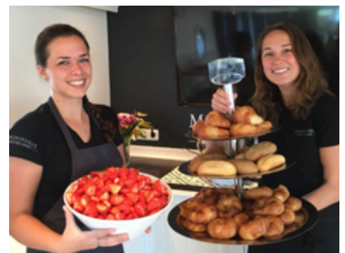
Willkommen an Bord