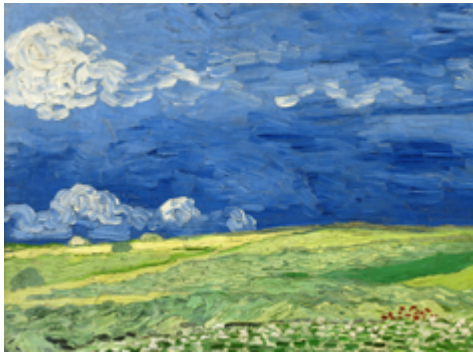
Van Gogh, Weizenfeld unter Gewitterwolken