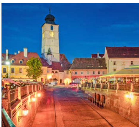
Abendliches Sibiu (Hermannstadt)

mit Pultdach (Rathausurm, Weberturm) sowie von einer Bastei (Scheidungshaus bzw. Ehegefängnis). Die Kirchenburg ist alljährlich der Schauplatz des sogenannten »Sachsentreffens« der noch in Siebenbürgen verbliebenen Siebenbürger Sachsen. Anschließend fahren Sie weiter Richtung Hermannstadt (2017 Kulturhauptstadt Europas). Nach einer kurzen Stadtbesichtigung folgt das Abendessen in einem landestypischen Bauernhaus. Übernachtung im Continental Forum direkt in der historischen Altstadt in Hermannstadt.