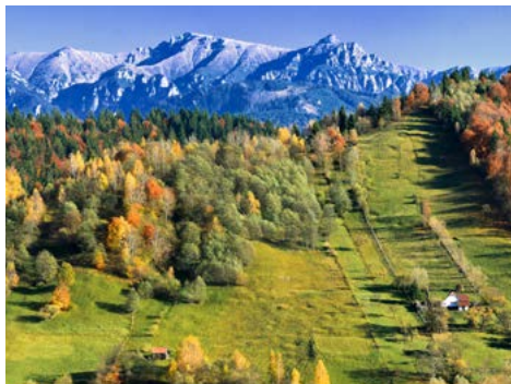
Herbst in den Karpaten © MEDIAIMAG - stock.adobe.com, GLOBALIS