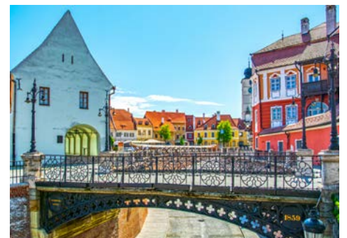
Altstadt von Sibiu (Hermannstadt)

Heute fahren Sie zuerst nach Biertan. Hier erwartet Sie die prächtige Kirchenburg, eine spätgotische Anlage in der historischen Landschaft von Siebenbürgen. Erbaut wurde sie Ende des 15. Jahrhunderts von Siebenbürger Sachsen und war damals als römisch-katholische Kirche Maria geweiht. Die Hallenkirche wird umgeben von drei Ringmauern, sechs Türmen mit Pyramidendach, zwei Türmen