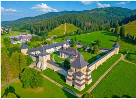
Kloster von Sucevita © dudlajzov - stock.adobe.com, GLOBALIS