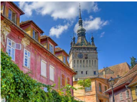
Stundturm in Schäßburg