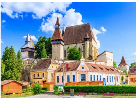
Kirchenburg von Biertan

Von Siebenbürgen starten Sie Ihre heutige Fahrt und besichtigen die Wehrkirche von Honigberg (Harman) in der historischen Region Burzenland. Die berühmten Wehrkirchen von Siebenbürgen zählen zum UNESCO-Weltkulturerbe. Der ungarische König Andreas II. verließ 1211 das Burzenland dem Deutschen Ritterorden, der sich hier niederließ, Burgen baute, deutsche Siedler ins Land brachte und Dörfer