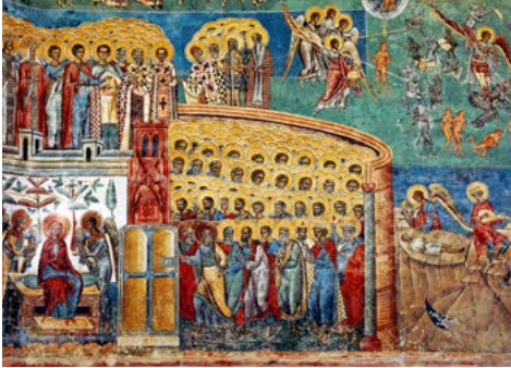
Wandmalerei im Kloster Voronet

Zunächst besichtigen Sie Schloss Bran, angeblich das Schloss des Fürsten Vlad III., auch bekannt als Graf Dracula. In allen Ecken erwarten Sie Schauer- geschichten. Anschließend fahren Sie nach Kron- stadt, eines der Zentren der Siebenbürger Sachsen. Sie wurde von den Ritterbrüdern des Deutschen Ordens im frühen 13. Jahrhundert als südöstlichste deutsche Stadt in Siebenbürgen gegründet. Hier umgibt Sie eine prachtvolle Altstadt mit viel Barock, urigen Cafés und engen Gassen. Höhepunkte sind die versteckte orthodoxe Kirche, sowie die Schwarze Kirche. Das markante Wahrzeichen der Stadt ist eine gotische Hallenkirche und wurde 1477 erbaut. Danach sehen Sie die Kirchenburg von Tartlau (Prejmer), eine UNESCO-Welterbestätte. Wieder in Predeal angekommen erwartet Sie am Abend ein typisch rumänisches Abendessen mit Lagerfeuer und Volksmusik. Übernachtung im Orizont Hotel in Predeal.