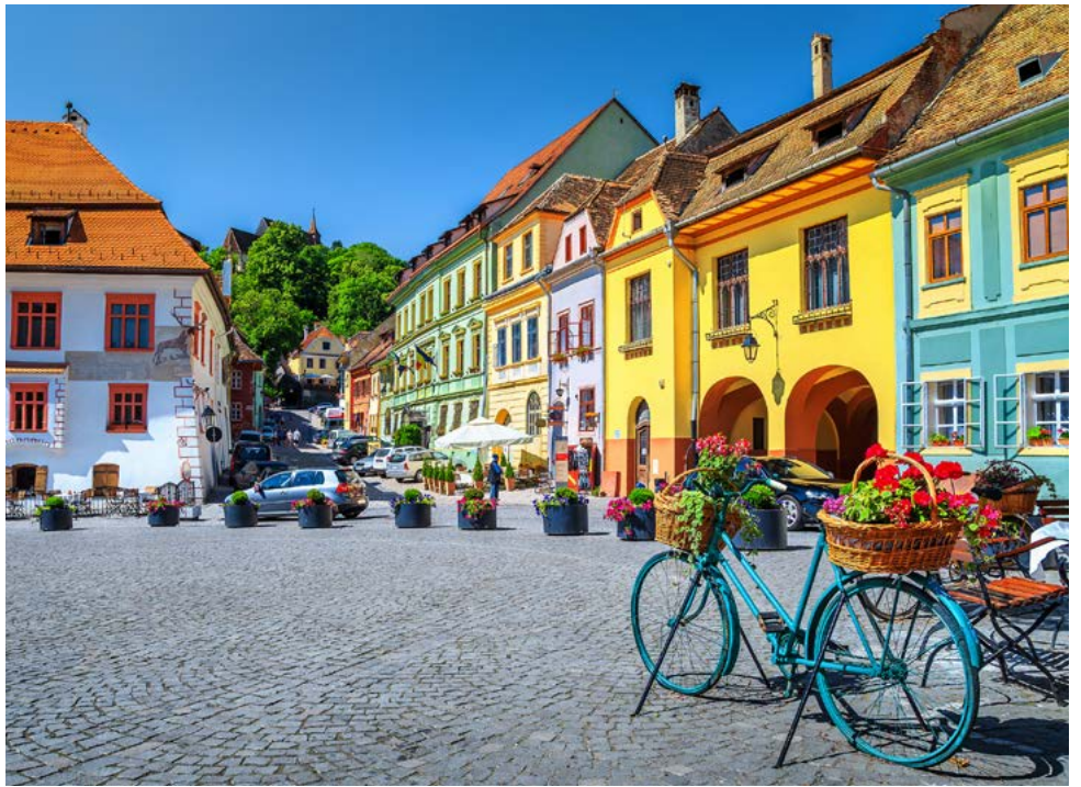
In Sighisoara (Schäßburg)