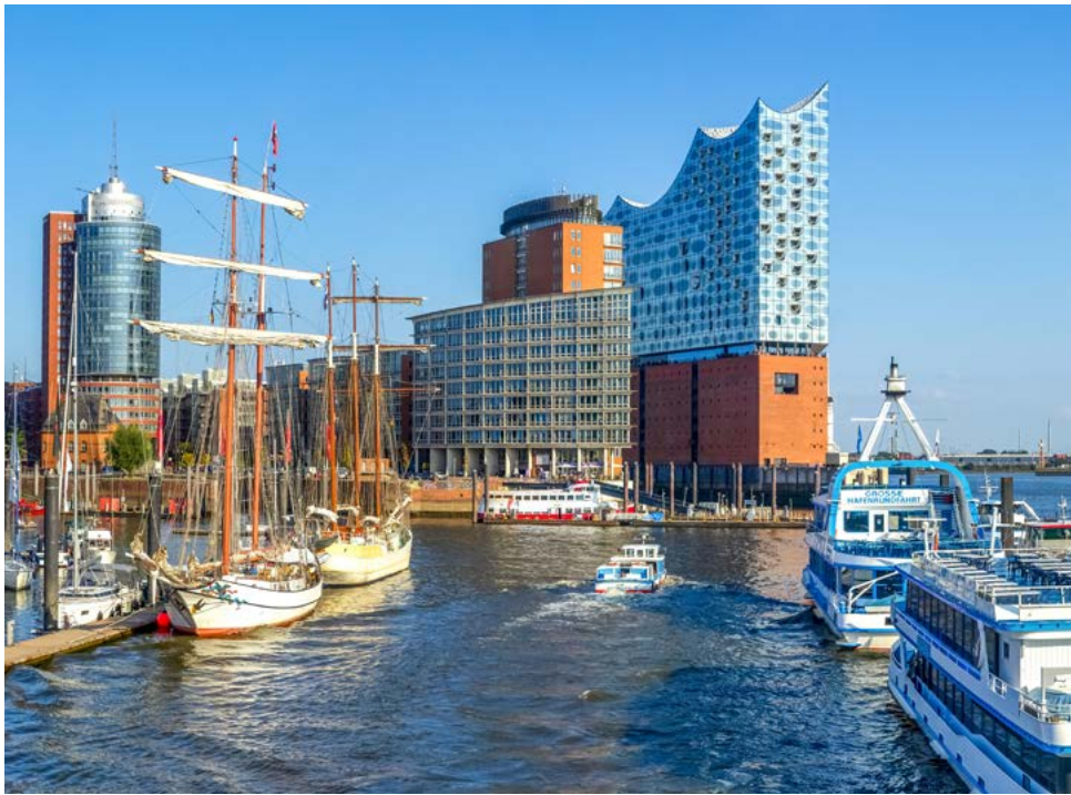
Die Elbphilharmonie am Hamburger Hafen