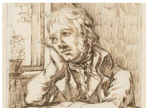
Selbstbildnis mit aufgestütztem Arm, um 1802

Die Geschichte der Schifferbörse findet bereits im 13. Jahrhundert ihren Ursprung. In alten Zeiten vollzog sich der Handel der Frachtrate zunächst im Hafen. Dort handelte man die Konditionen aus. Im Rathaus wurden im zweiten Schritt die Verträge im Schuldbuch beurkundet. Zu guter Letzt traf man sich im Gasthaus bei einem Humpen Wein. Mit die-