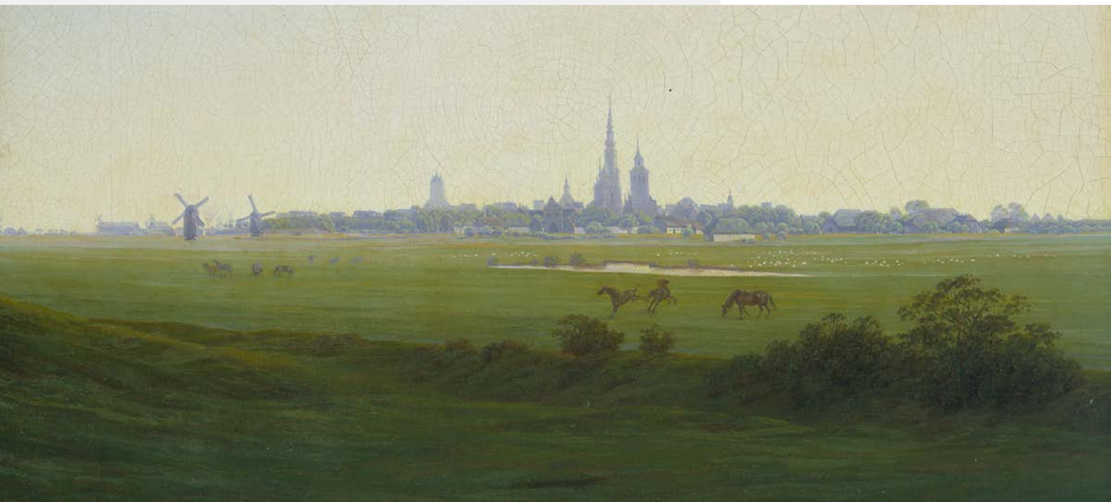
Caspar David Friedrich, Wiesen bei Greifswald, 1821/22