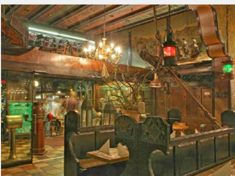
In der Schifferbörse

Genießen Sie zunächst das reichhaltige Frühstücksbuffet im Reichshof. Am späten Vormittag / Mittag geht es in die nur wenige Gehminuten entfernte Hamburger Kunsthalle. Dort erwartet Sie zunächst eine ca. 90-minütige Führung durch die großartige Sonderausstellung »Caspar David Friedrich. Kunst