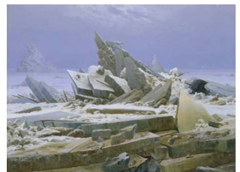
Caspar David Friedrich, Das Eismeer, 1823/24