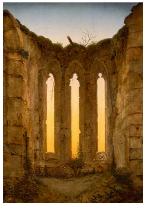
Caspar David Friedrich, Kirchenruine Oybin

Trotz seines großen künstlerischen Talents und seiner innovativen Herangehensweise an die Landschaftsmalerei blieb Friedrich zu Lebzeiten relativ unbekannt. Erst in der zweiten Hälfte des 19. Jahrhunderts wurde sein Werk von nachfolgenden Künstlern und Kunstkritikern gewürdigt und anerkannt. Heute gilt Caspar David Friedrich als einer der herausragendsten Maler des 19. Jahrhunderts und sein Einfluss auf die Kunstgeschichte ist unbestreitbar. Seine Werke werden weltweit in renommierten Museen und Galerien ausgestellt und haben bis heute eine starke Anziehungskraft auf Kunstliebhaber und Betrachter.