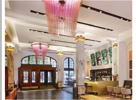
Im Stil der 20er Jahre