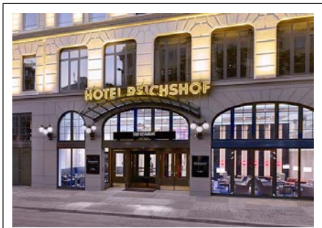
Hotel Reichshof Hamburg

Ein charakteristisches Merkmal seiner Werke war auch die häufige Darstellung von Ruinen, verfallenen Gebäuden und Friedhöfen, die symbolisch für Vergänglichkeit und Transzendenz standen. Diese Motive drückten oft auch seine tiefe Religiosität und seine Auseinandersetzung mit metaphysischen Fragen aus.