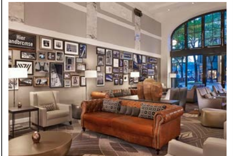
Lobby des Hotels Reichshof