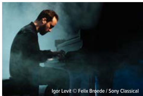
Igor Levit