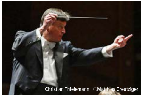
Christian Thielemann