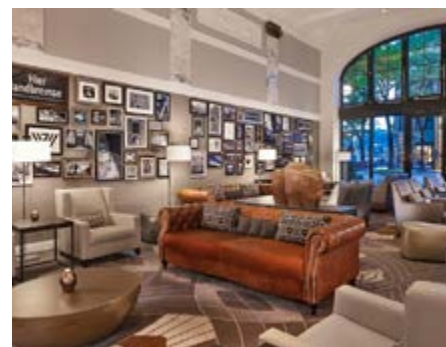
Lobby des Hotels Reichshof