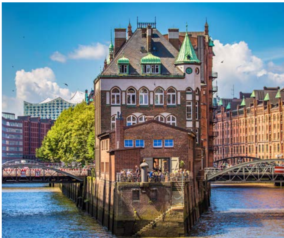
In der Speicherstadt