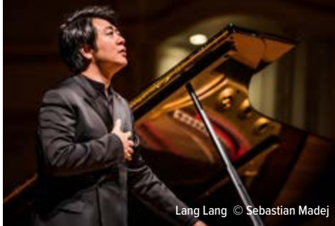
Lang Lang