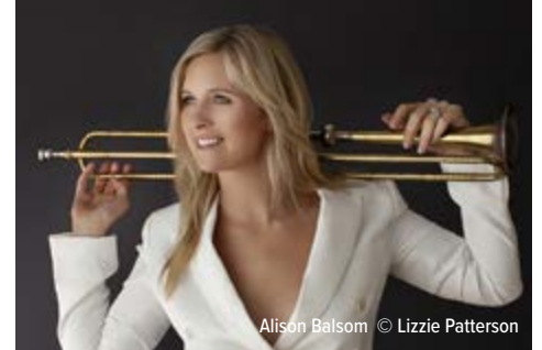
Alison Balsom