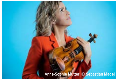
Anne-Sophie Mutter