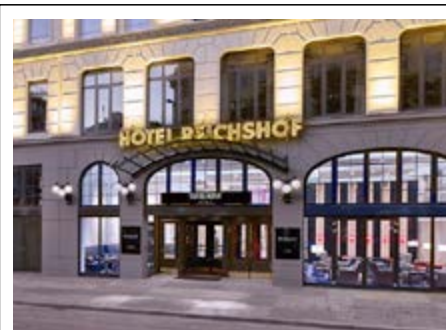
Hotel Reichshof Hamburg