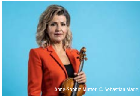
Anne-Sophie Mutter