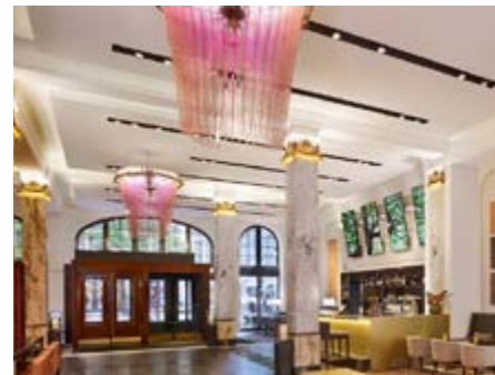
Im Stil der 20er Jahre