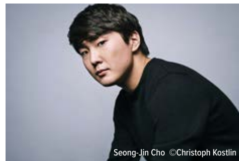
Seong-Jin Cho