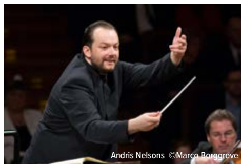
Andris Nelsons