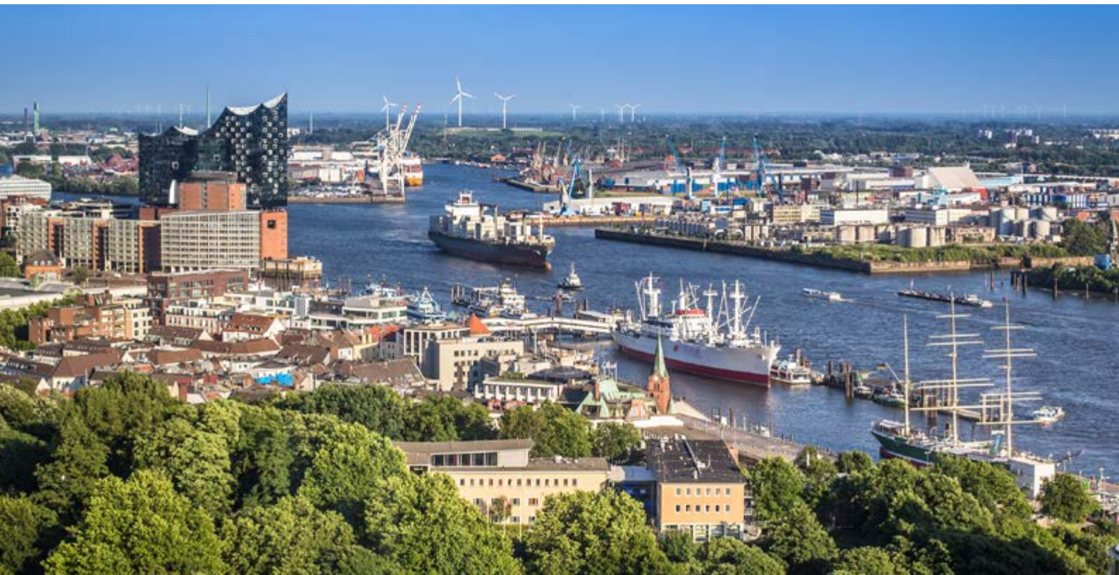
Der Hamburger Hafen - Deutschlands Tor zur Welt