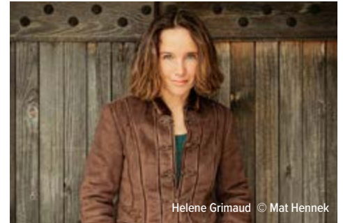
Helene Grimaud