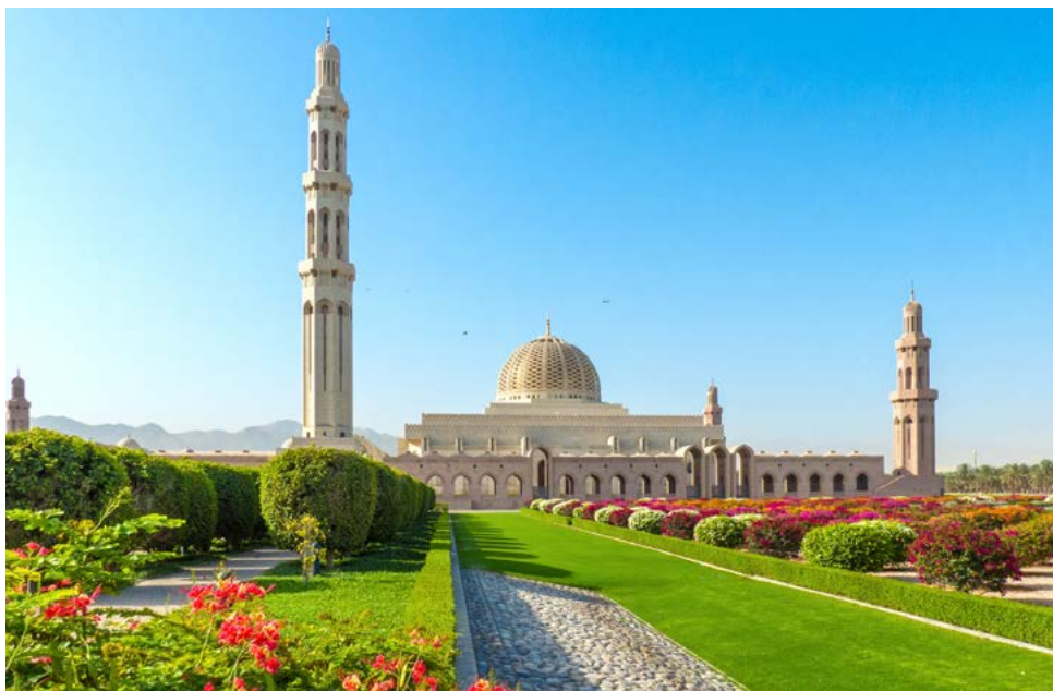
Sultan Qaboos Grand Mosque in Maskat