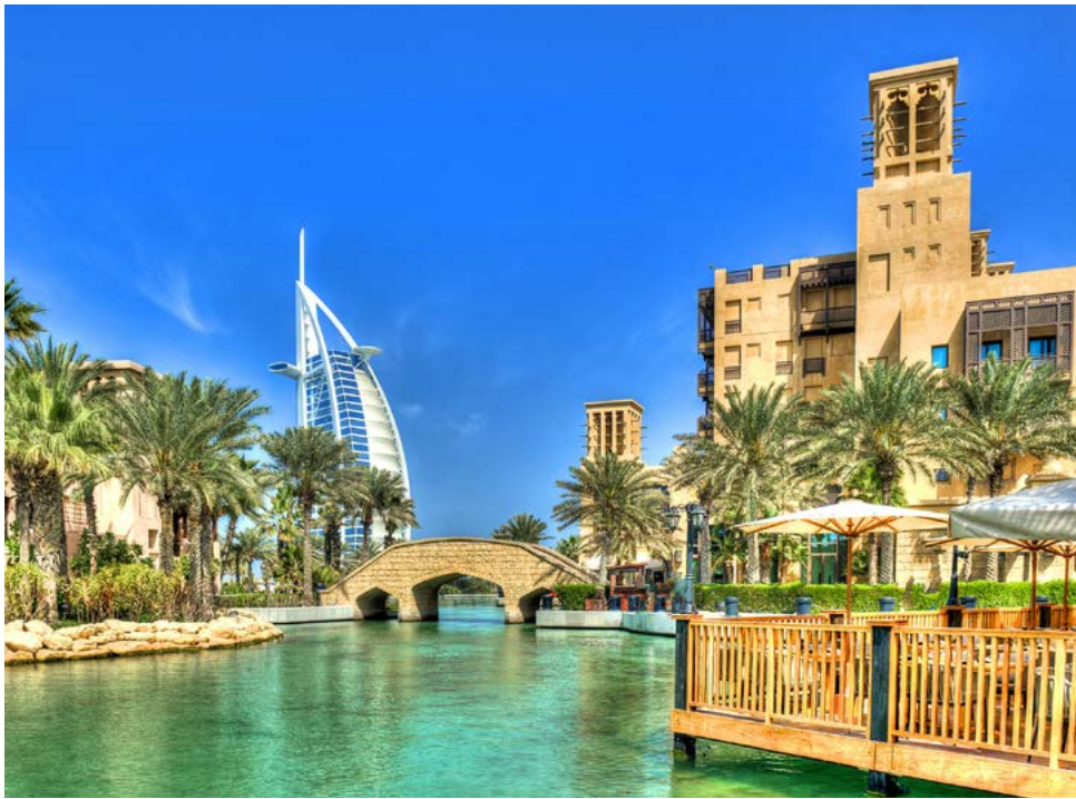
Ehemaliges Wahrzeichen von Dubai: das Burj al Arab