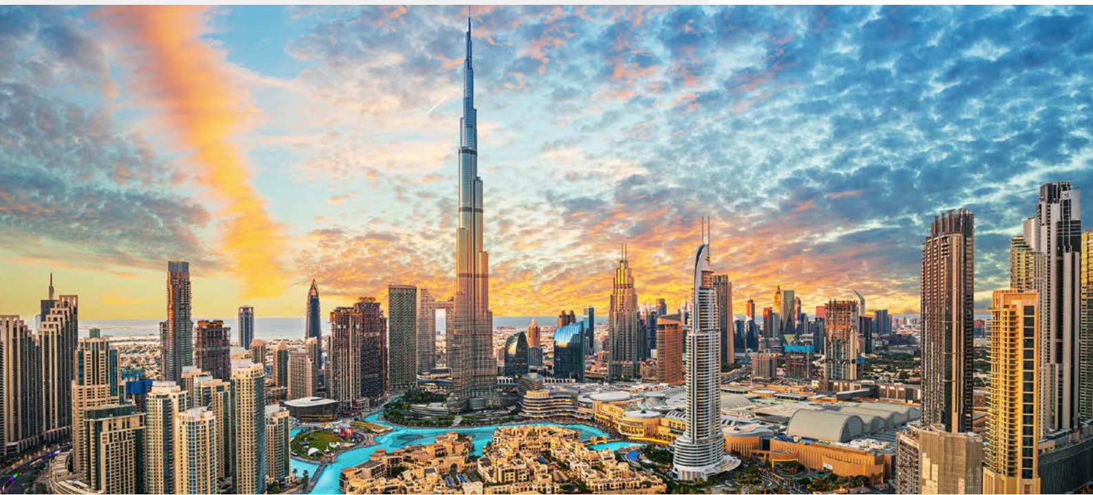
Der Burj Khalifa in Dubai