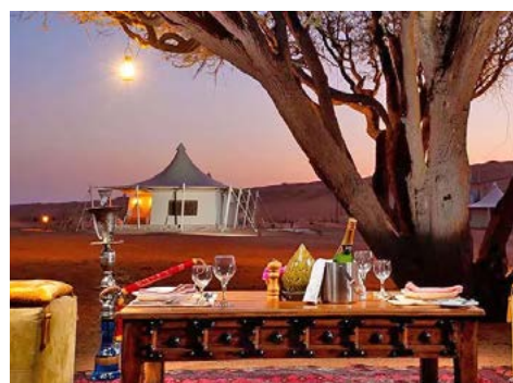
Wüstencamp Wahiba Sands

Ein ganzer Tag für die omanische Hauptstadt mit ihren vielen Sehenswürdigkeiten. Auf der ca. 4-stündigen Stadtrundfahrt zeigen wir Ihnen alle Sehenswürdigkeiten Maskats und beginnen mit ei-