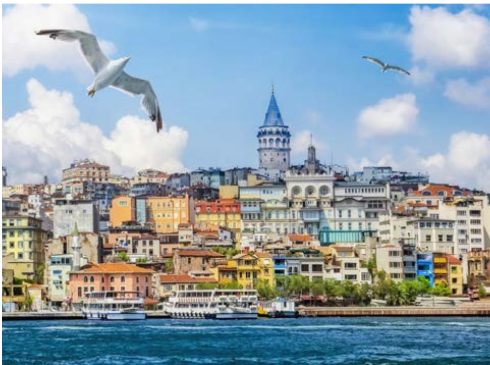
Der Galataturm am Goldenen Horn