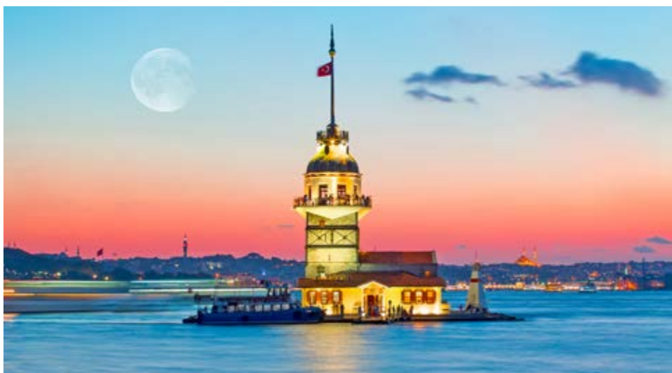
Der Länderturm im Bosphorus