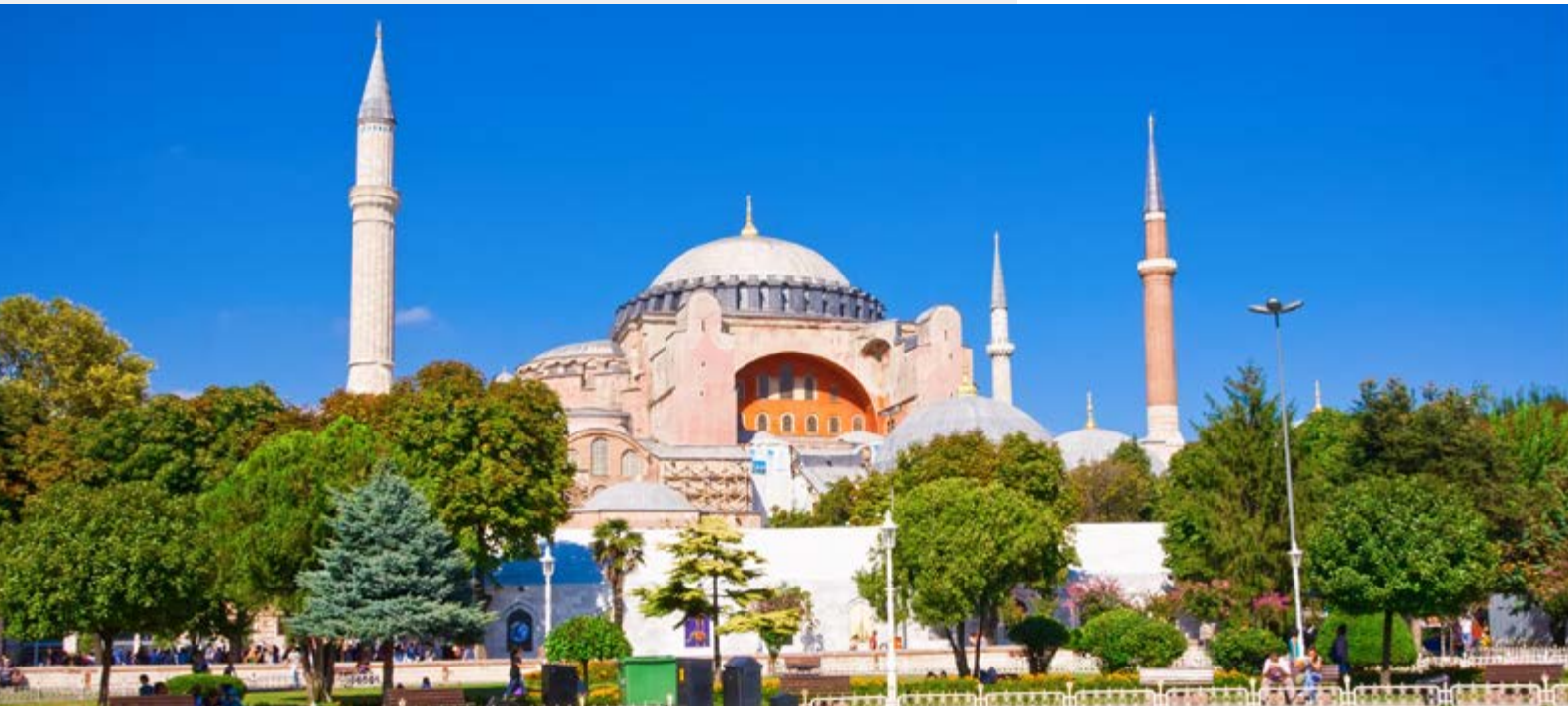
Die Hagia Sophia