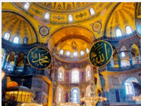
In der Hagia Sophia