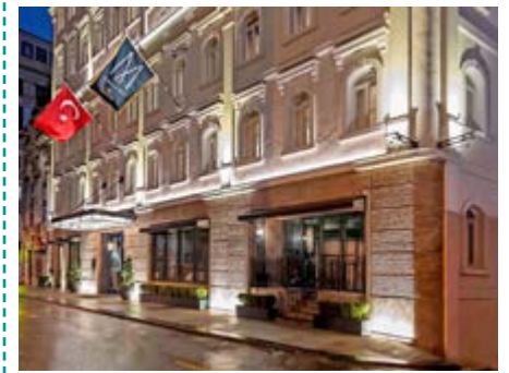
The Galata Istanbul Hotel MGallery