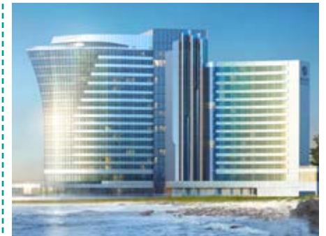
Hyatt Regency Istanbul Ataköy