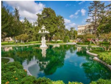
Park des Dolmabahçe Palasts