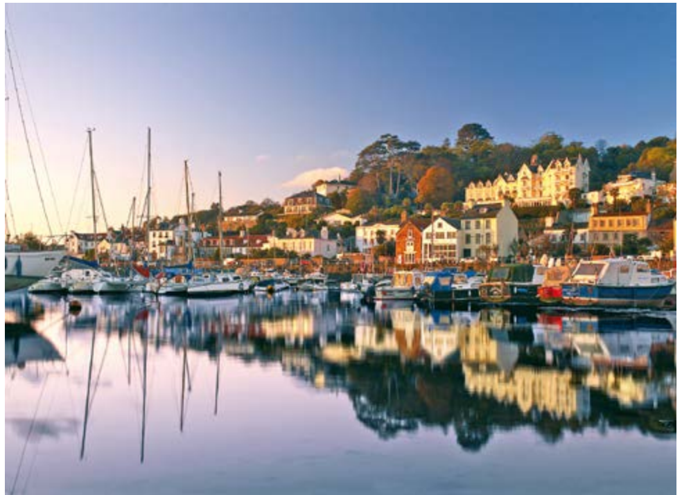
St. Aubin Harbour

Es ist eine romantische Fahrt durch eine Landschaft, in der gewaltige Eichen und Kastanien Akzente