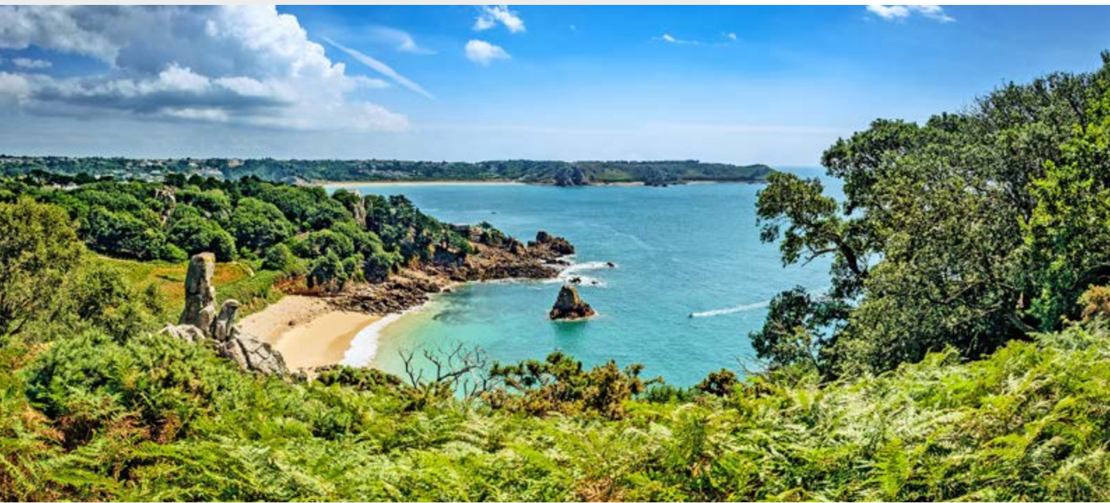
Beauport Bay auf Jersey