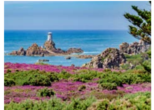
Die reizvolle Küste Jerseys