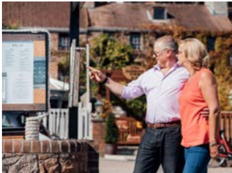
In St. Aubin