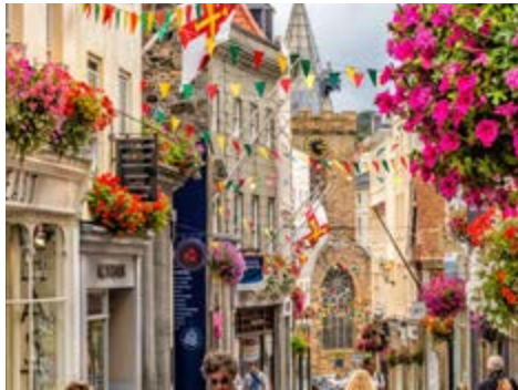
St. Peter Port