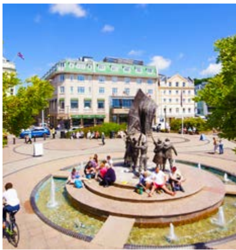
Hotel Pomme d'Or

Darunter liegt ein ca. 6000 Jahre altes neolithisches Ganggrab. Anders als bei anderen Ganggräbern können Sie im Inneren der Kammer aufrecht stehen und diesen Platz der Verehrung bestaunen. Es gibt zudem ein faszinierendes, geologisches und archäologisches Museum, in dem unter anderem Münzschatze, Äxte, Schwerter und Speere aus der Jungsteinzeit ausgestellt werden. La Hougue Bie besitzt außerdem einen Kommandobunker aus der Zeit der deutschen Besatzung sowie ein Denkmal, das den Zwangsarbeitern gewidmet ist, die während des Zweiten Weltkriegs von den Nazis auf die Kanalinseln gebracht wurden.