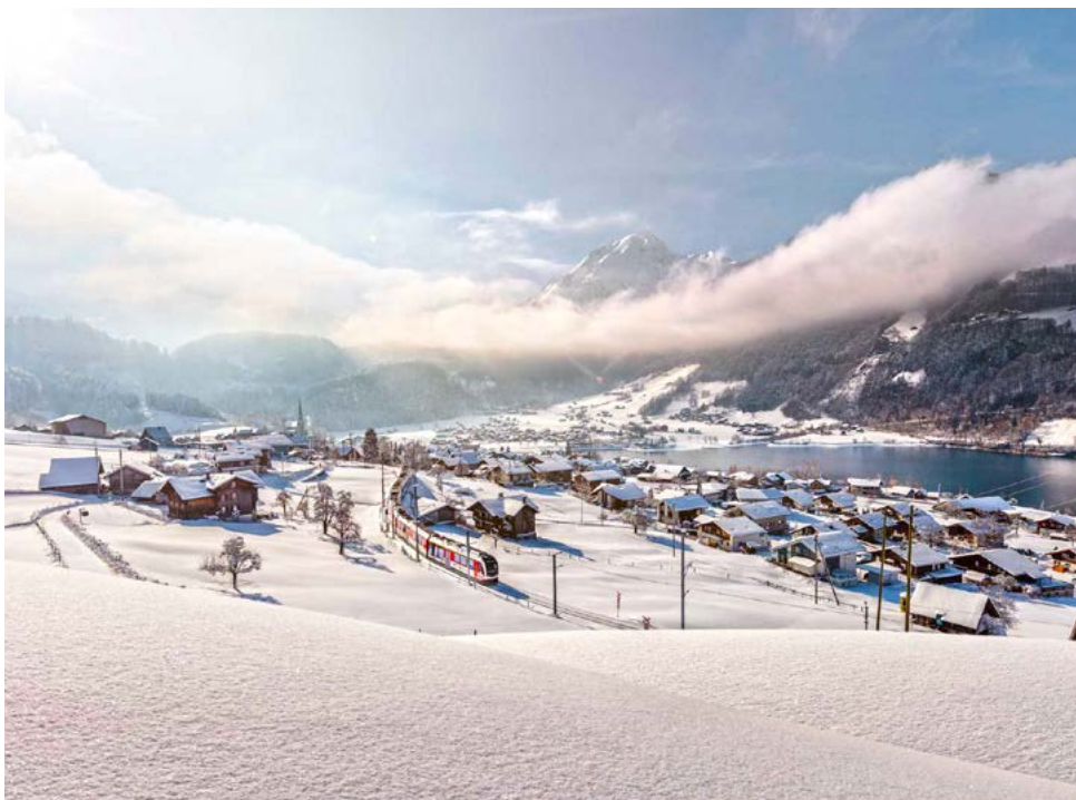
Luzern-Interlaken Express im Winter, Lungernsee