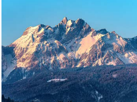
Blick auf den Pilatus