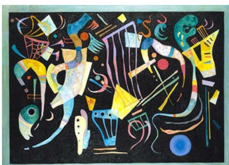
Kandinsky: «Formes Multiples», Sammlung Rosengart

Die modernen Zimmer des Hotels sind gut ausgestattet und verfügen über ein Bad mit bodentiefer Dusche mit WC, Sat-TV, Teekoher und ein kostenfreies WiFi-Angebot. Zum Frühstück bediene Sie sich am Holiday Inn-Frühstücksbuffet. Im Umfeld des Hotels befindet sich das Marche-Restaurant der bekannten Schweizer Hotel- und Restaurantkette Mövenpick, ein Coop-Supermarkt und weitere Einkaufsmöglichkeiten. Das Holiday Inn verfügt über eine kleine Bar.