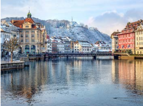
Winterliches Luzern