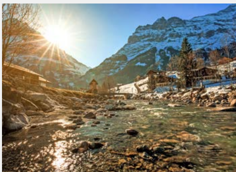
Idylle bei Interlaken