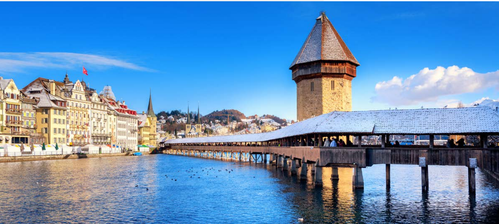
Kapellbrücke in Luzern