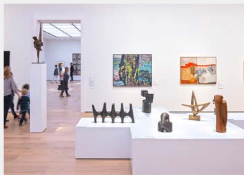
Im Nationalmuseum Oslo