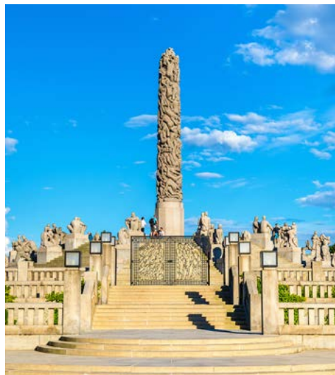
Frogner Park - Oslo

Der heutige Tag gehört nahezu komplett dem großartigen am 11.6.2022 eröffnetem Nationalmuseum Oslos. Eigentlich beherbergt es fünf Museen unter einem Dach. Stellen Sie sich Ihren ganz individuellen Museumsrundgang zusammen, oder aber entdecken Sie die vielen Höhepunkte der umfangreichen Sammlungen zusammen mit Ihrem Globalis-Reiseleiter. Er kennt das Haus bereits bestens und steht Ihnen mit vielen Tipps und Anregungen zur Seite. Auch im Nationalmuseum finden Sie viele Werke des norwegischen Malers von Weltruf Edvard Munch, u.a. das bereits erwähnte erste Gemälde mit dem Titel „Der Schrei“. Um 15:30 Uhr unternehmen wir dann eine Bootstour durch die Fjordwelt Oslos und genießen das sich uns bietende Panorama und die malerische Fjordwelt. Die Tour endet gegen 18:00 Uhr wieder in