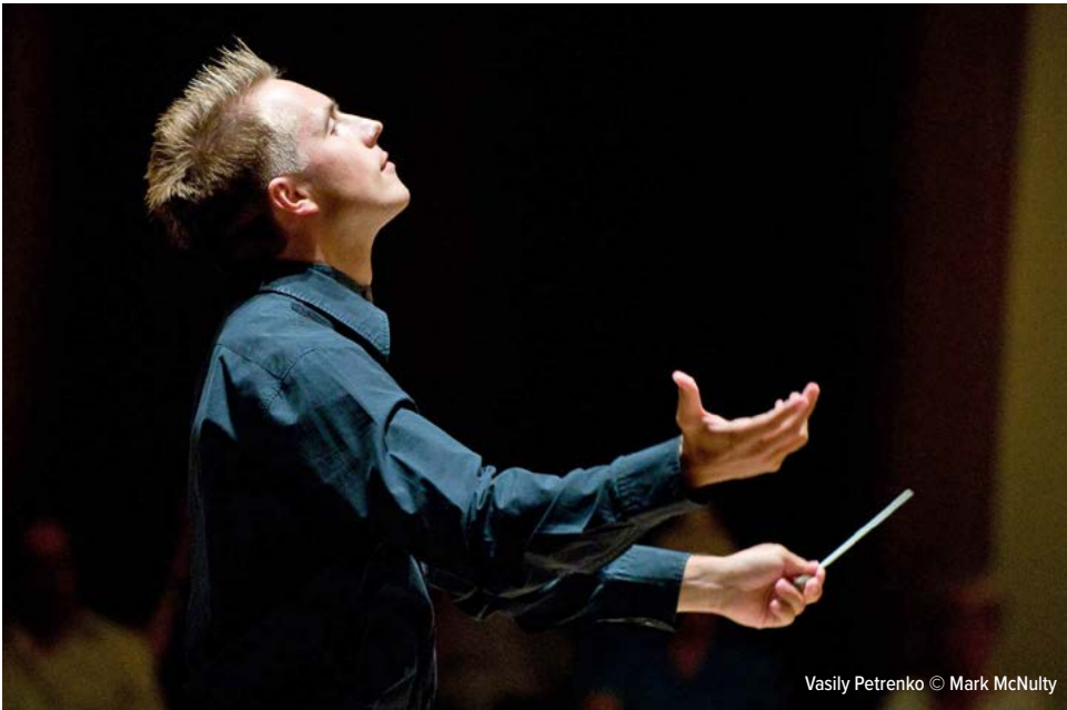
Vasily Petrenko