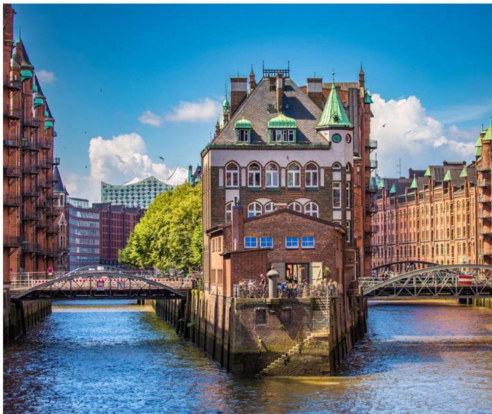
In der Speicherstadt