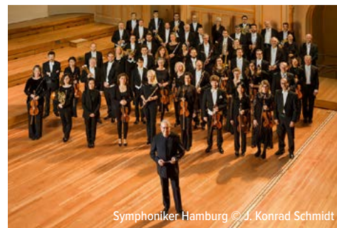
Symphoniker Hamburg

Reisetermin: Do. 03.10. – So. 06.10.2024