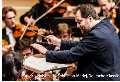
Andris Nelsons