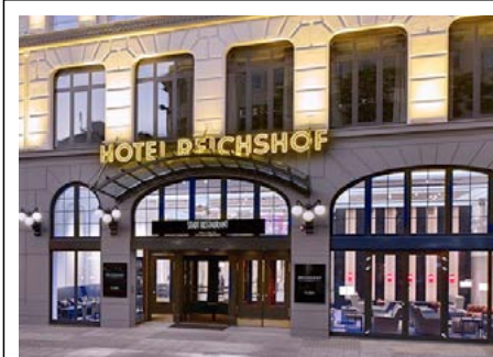
Hotel Reichshof Hamburg