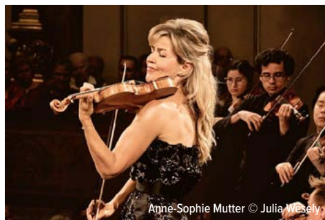
Anne-Sophie Mutter