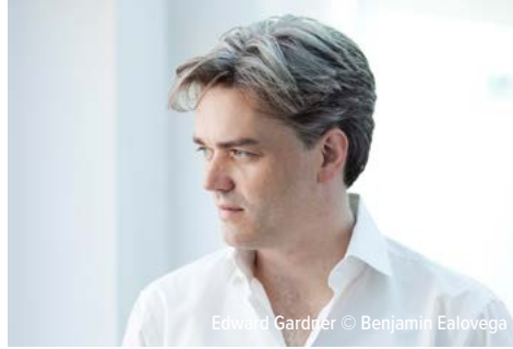
Edward Gardner