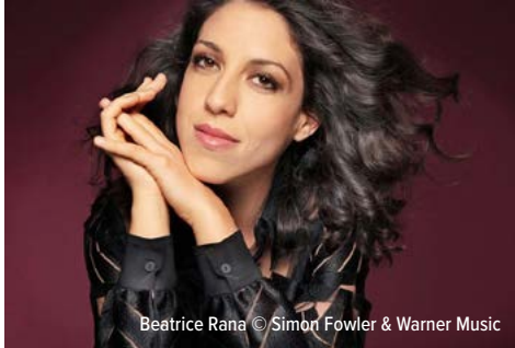
Beatrice Rana