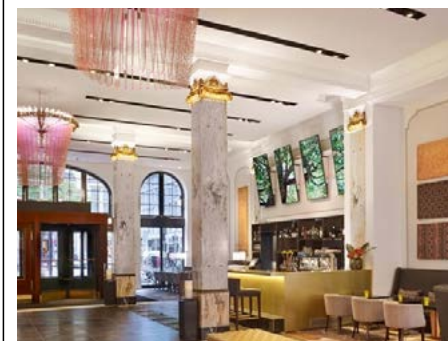
Im Stil der 20er Jahre