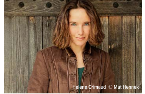
Helene Grimaud