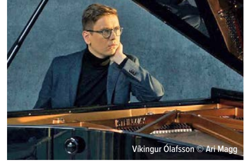
Víkingur Ólafsson