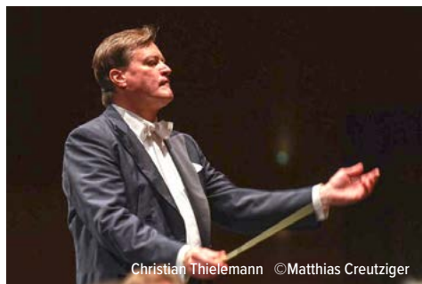
Christian Thielemann