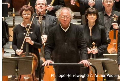
Philippe Herreweghe