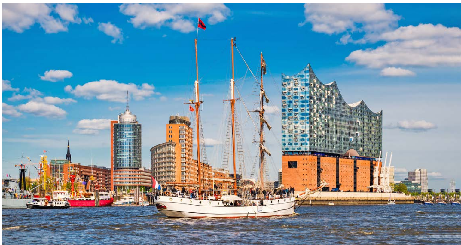
Im Hafen von Hamburg