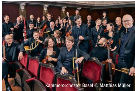
Kammerorchester Basel