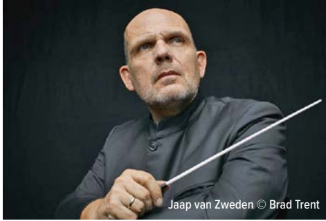
Jaap van Zweden