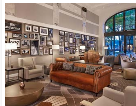
Lobby des Hotels Reichshof