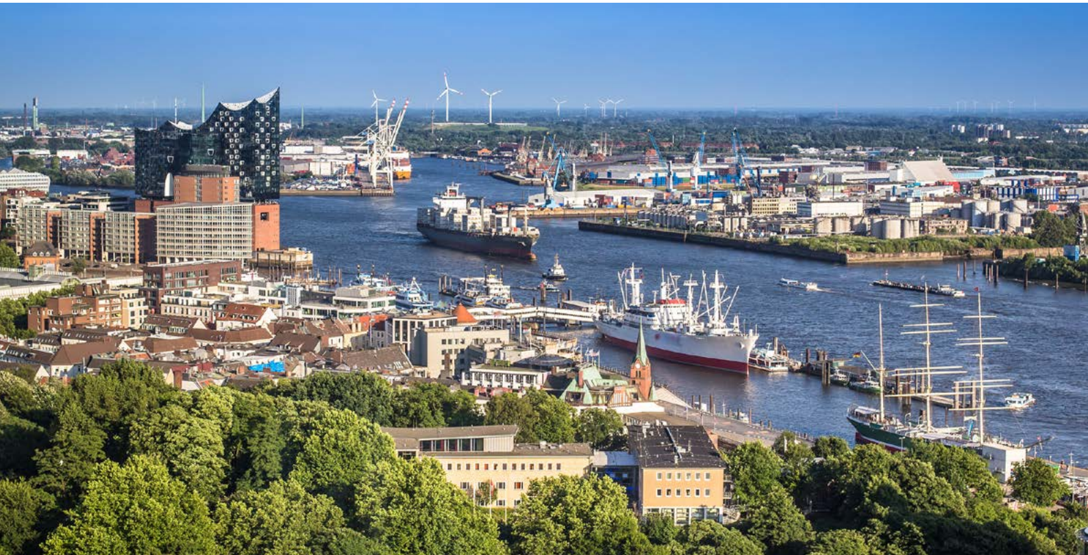
Der Hamburger Hafen - Deutschlands Tor zur Welt