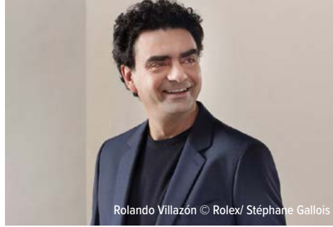
Rolando Villazón