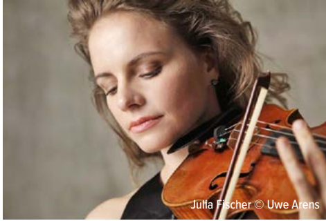
Julia Fischer